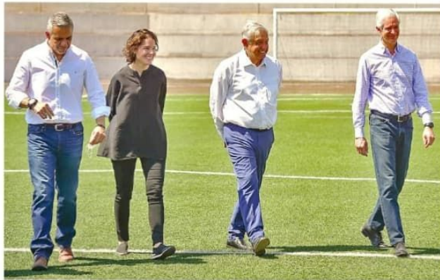
En Ecatepec, el Presidente Andrés Manuel Lopez Obrador supervisó la remodelación de un deportivo, junto con el Gobernador del Estado de México, Alfredo del Mazo (der.).