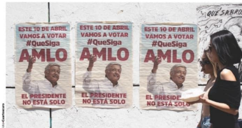
PUBLICIDAD en favor del Presidente para la consulta de revocación de mandato, que se realizará el 10 de abril.