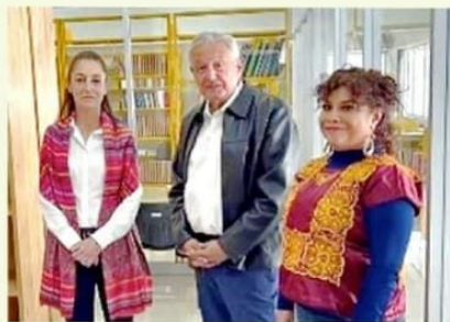
En Iztapalapa, con la Jefa de Gobierno de la Ciudad de México, Claudia Sheinbaum, y la alcaldesa Clara Brugada.

En acto fue privado, debido a la veda electoral, y